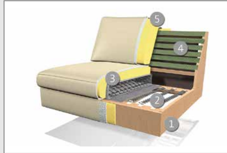
Das Design des hier abgebildeten Querschnitts entspricht nicht dem Modell dieses Katalogblattes.